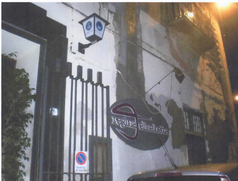
RISTORANTE " REGINA ELISABETTA "

Per chi ha necessità di pranzare o cenare a circa 150 mt. dal Quartier Generale OSMTJ Può essere accolto nel ristorante "REGINA ELISABETTA" (buon menù a buon prezzo) Via Marittima N° 11, Portici (NA) tel. 081 7768555.