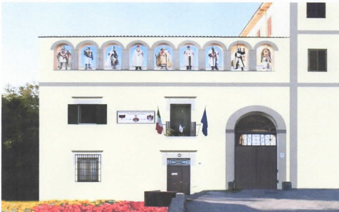
QUARTIER GENERALE O.S.M.T.J. 1804

Ore 17,00 Raduno dei postulanti, Cavalieri ed ospiti nel Quartier Generale dell'Ordine Sovrano Militare del Tempio di Jerusalem presso il Convento dei frati Minori sito in Portici (NA) in Piazza San Pasquale N° 10.