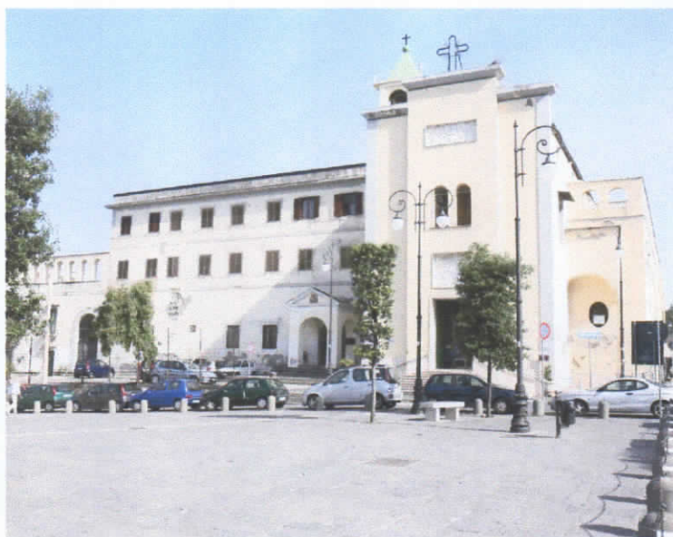
CONVENTO DEI FRATI MINORI PORTICI (NA)