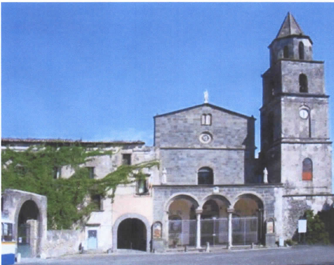
COMPLESSO MONUMENTALE DI SANTA MARIA DEL POZZO

Cari Fratelli e Sorelle, vi comunichiamo che il 35° Capitolo d'investitura di Cavalieri Templari ed il rituale di fine ed inizio anno Ordine 901°/902° si terranno il 15 marzo alle ore 18,00 nella buona terra di Somma Vesuviana nel Complesso Monumentale di Santa Maria del pozzo del Convento Franciscano dei Frati Minori in via Santa Maria del Pozzo N° 114.